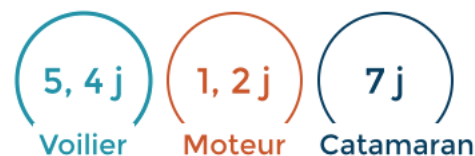
La durée moyenne de location par bateaux sur Sailsharing

Si vous avez un bateau moteur de type Open ou pêche-promenade, il est évident que vous louerez plutôt à la journée. Si vous possédez un voilier habitable, vous aurez plutôt tendance à louer à partir de deux jours, et jusqu'à deux ou trois semaines.